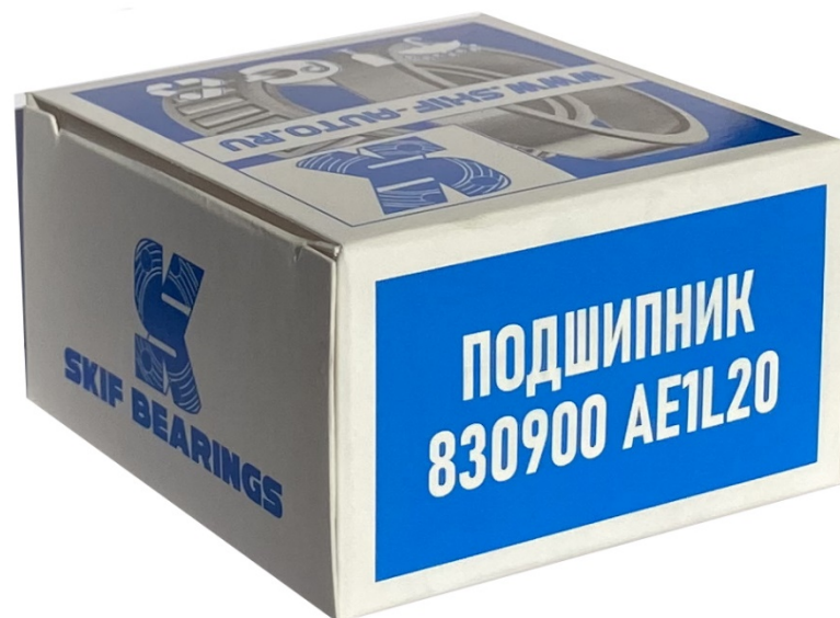
Ролик ГРМ 830900AE1 16 кл. натяжной 2112