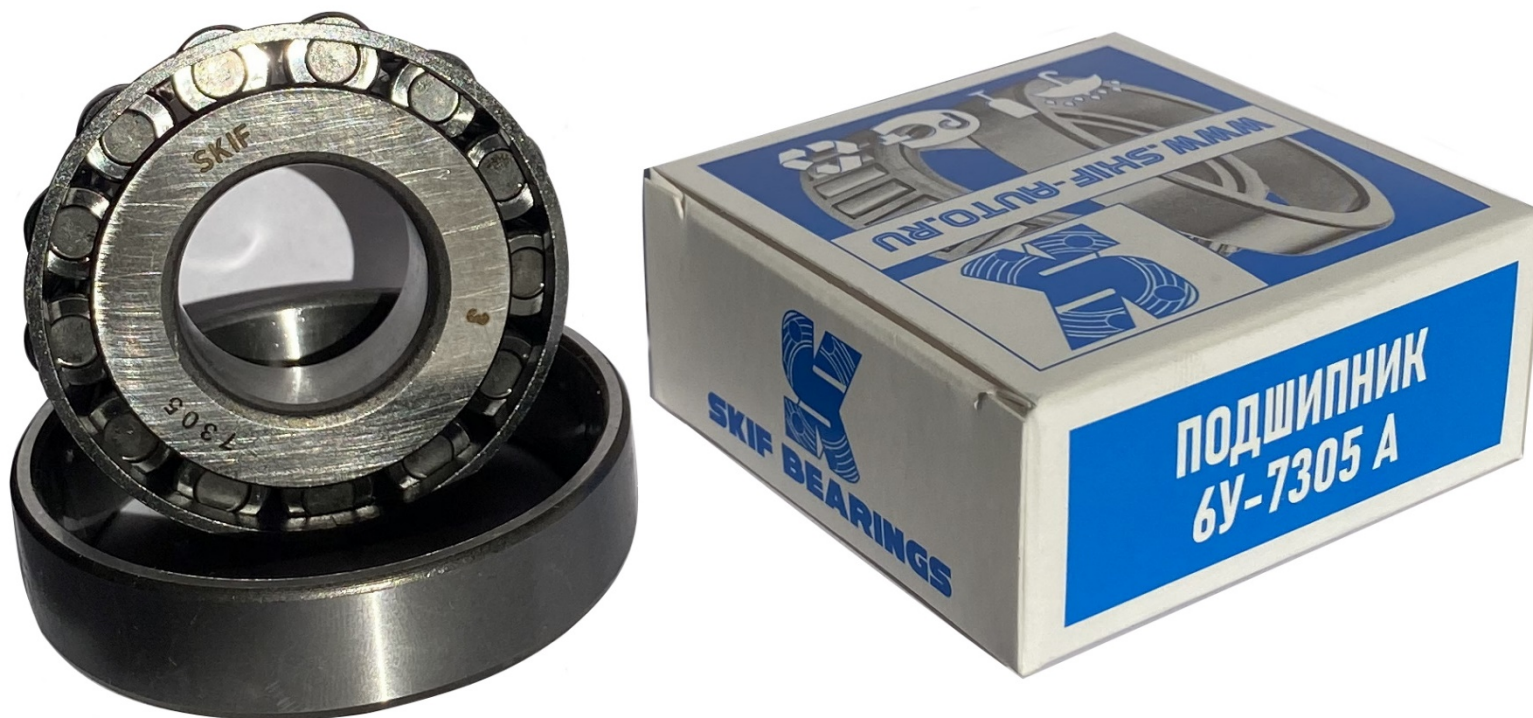
Подшипник 7305 ступицы передний ГАЗель наруж ступицы Волга-2410