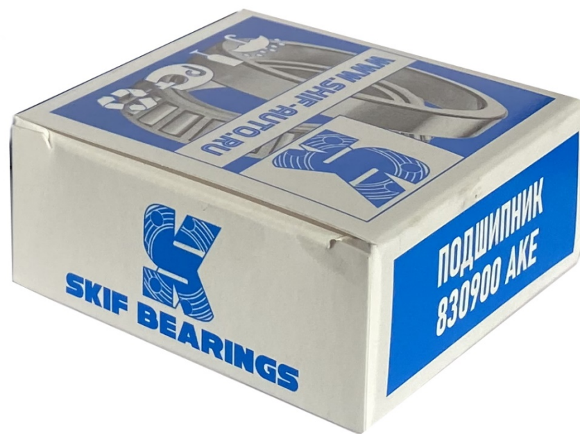
Ролик ГРМ 830900AKE ручейковый под конд. 2112