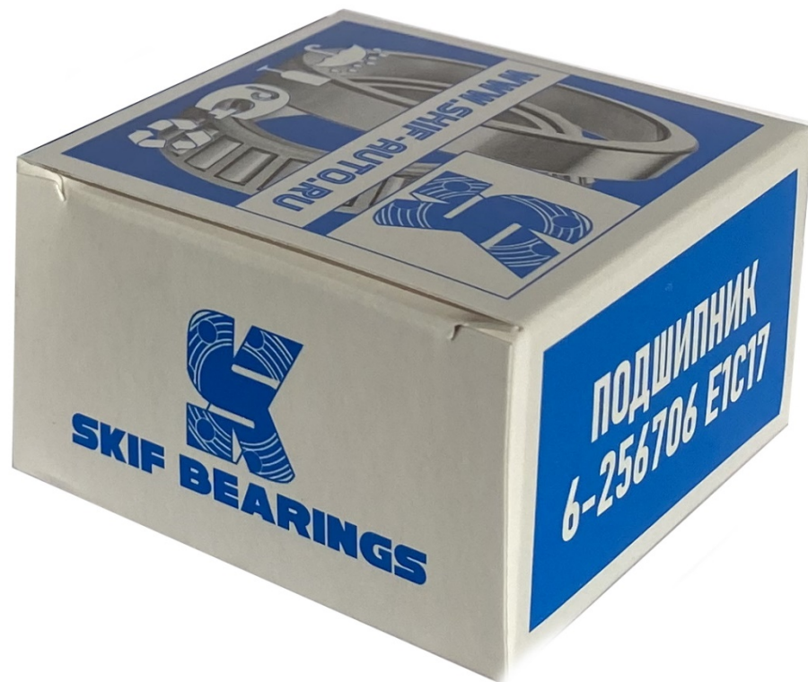
Подшипник 256706 задней ступицы 2108-2112