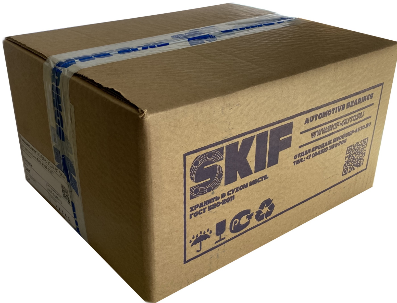
Стандартная упаковка к поставке на ящичную норму товара