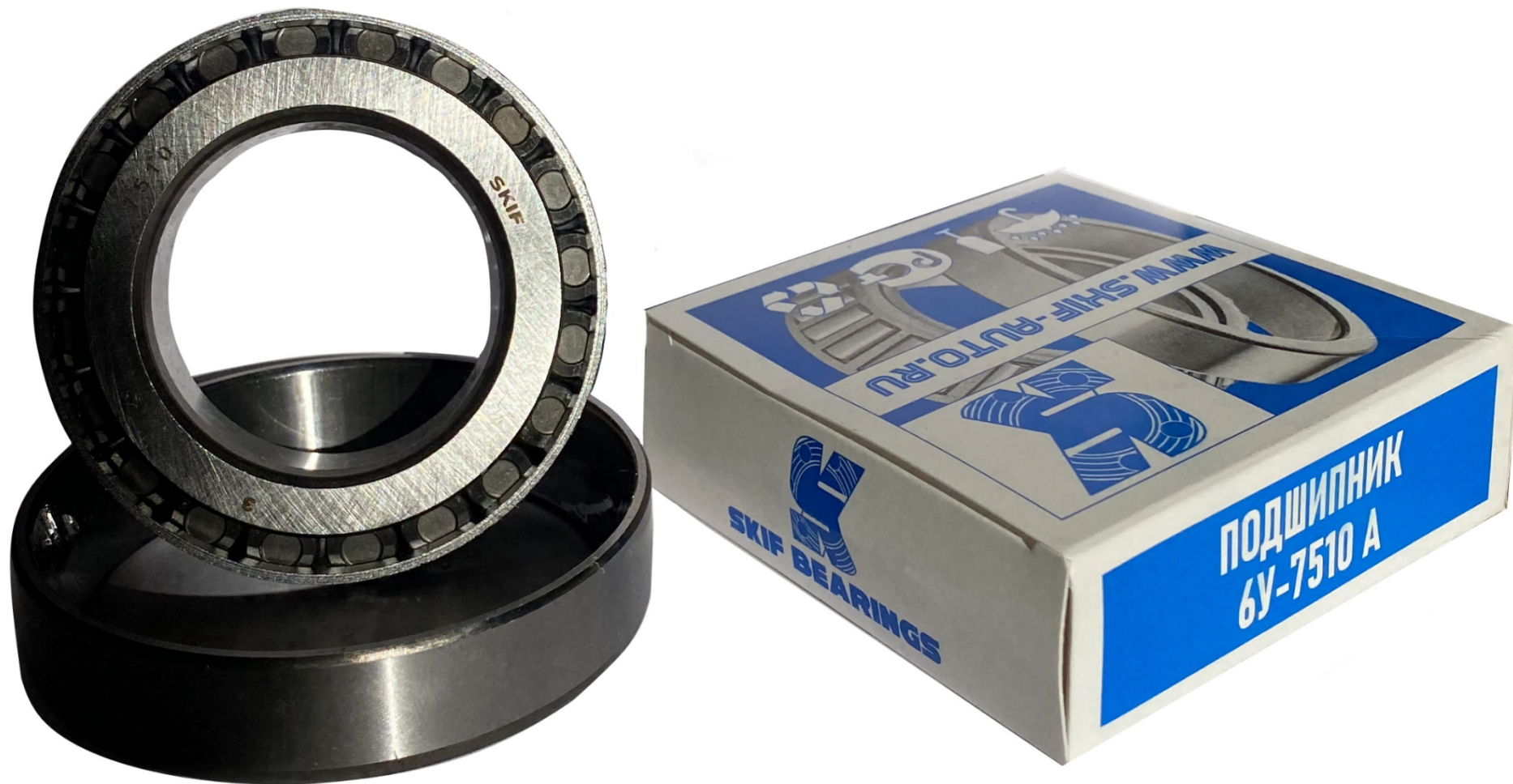
Подшипник 7510 ступицы ГАЗ 2217 3302 задний внутр/дифференциала