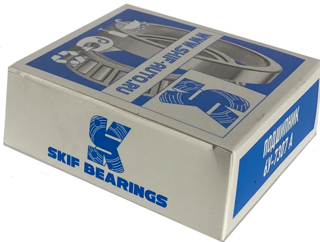
Подшипник 7307 ступицы передний ГАЗель внутр.