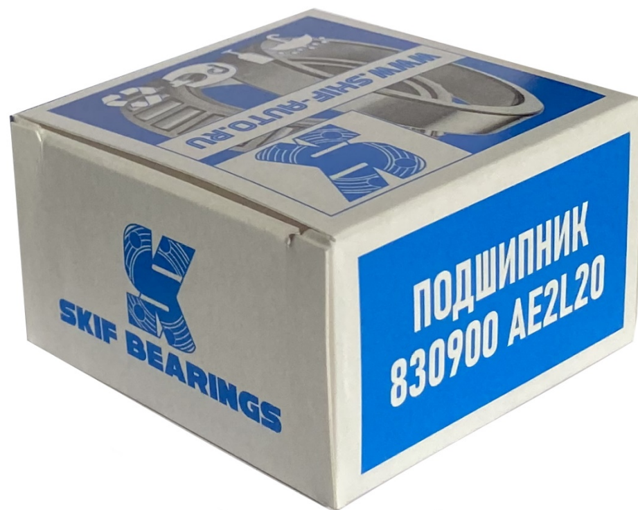
Ролик ГРМ 830900AE2 натяжной 2108 н/обр.