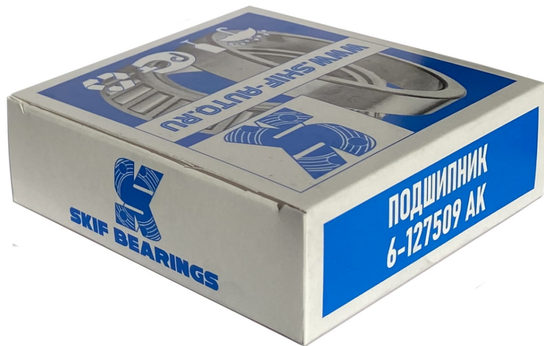
Подшипник 127509 ступицы УАЗ