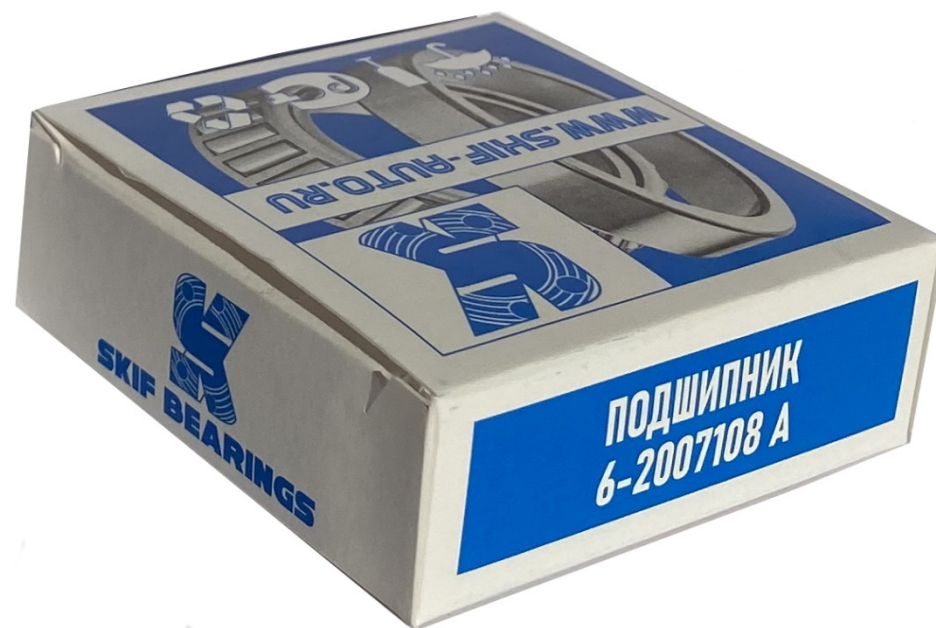
Подшипник 2007108 ступицы 2121НИВА