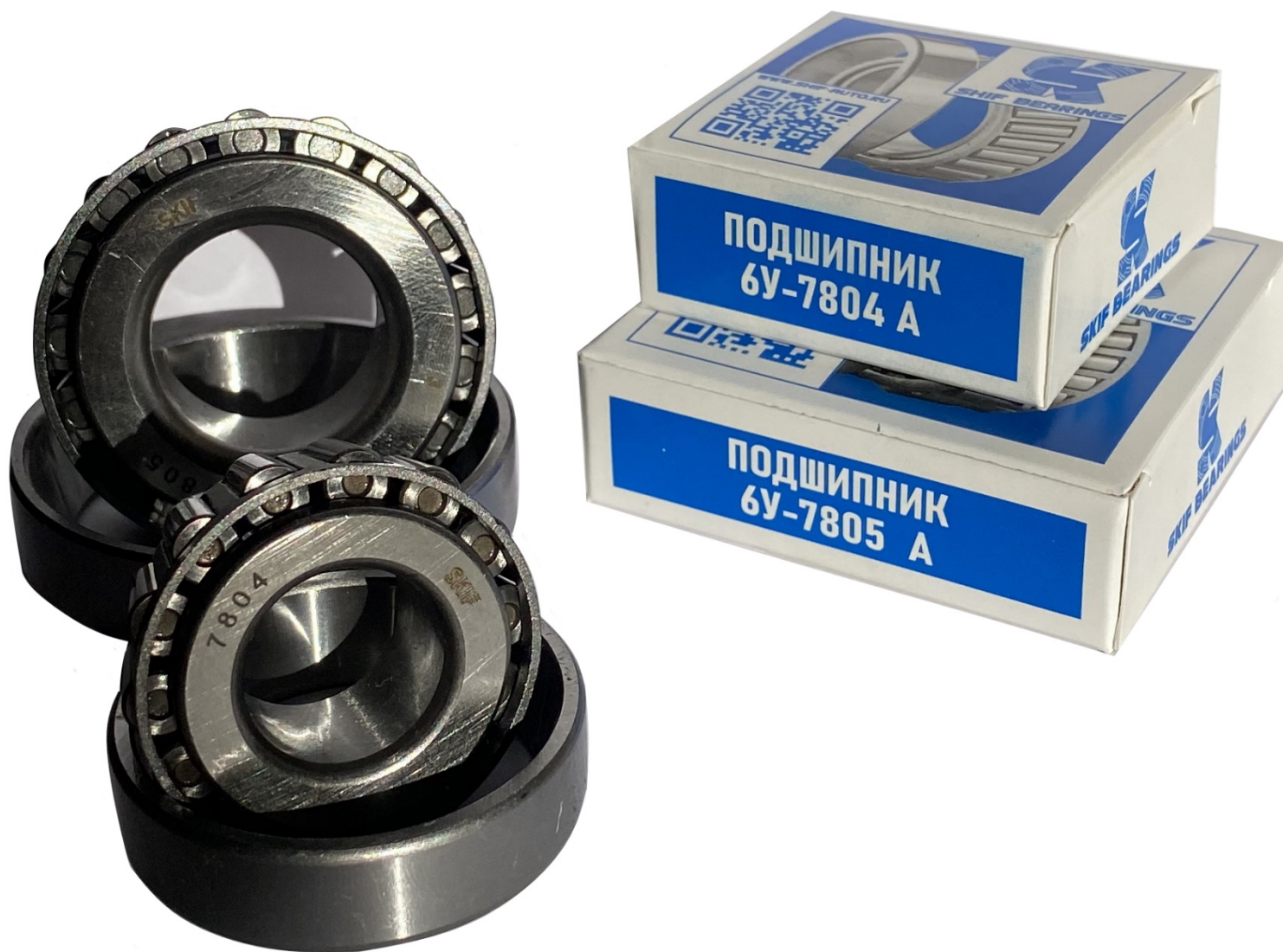
Подшипник 7804/7805 ступицы ВАЗ 2101-2107