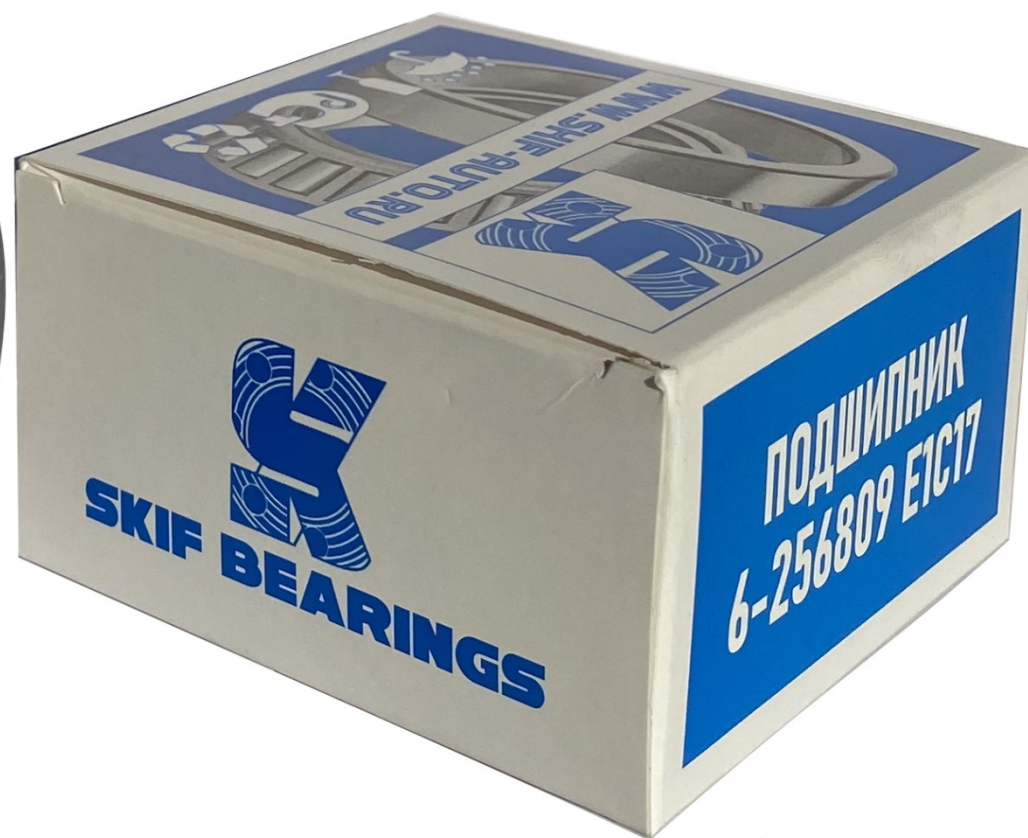
Подшипник 256809 ступицы передней 21214, УРБАН