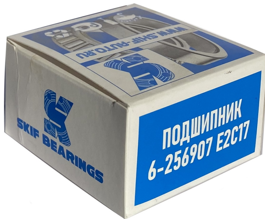
Подшипник 256907 ступицы передней 2108-2112