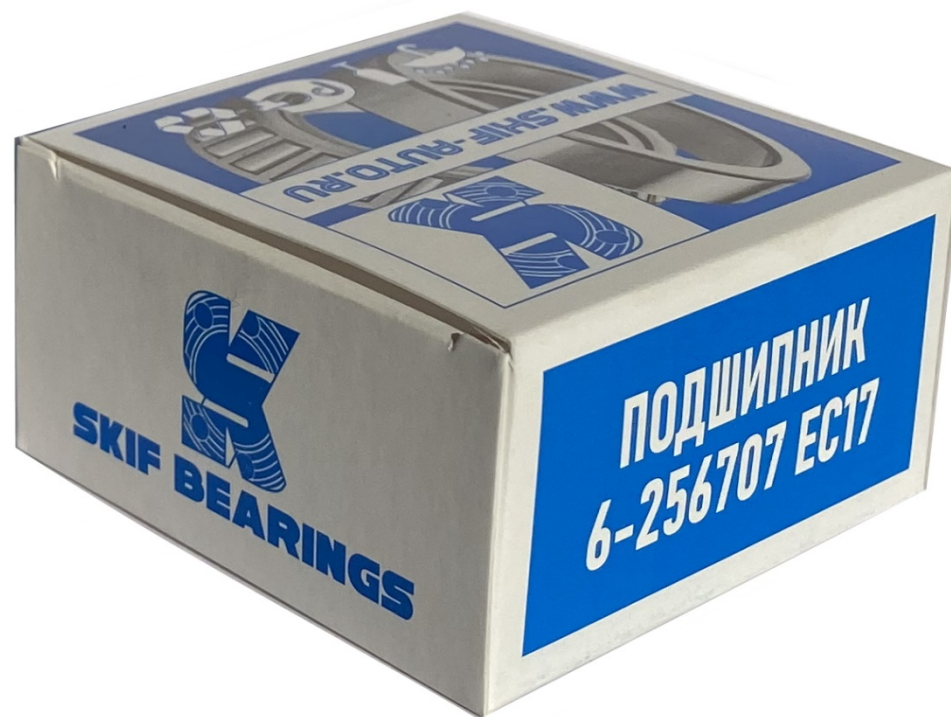
Подшипник 256707 передней ступицы 1 1 18 Капина