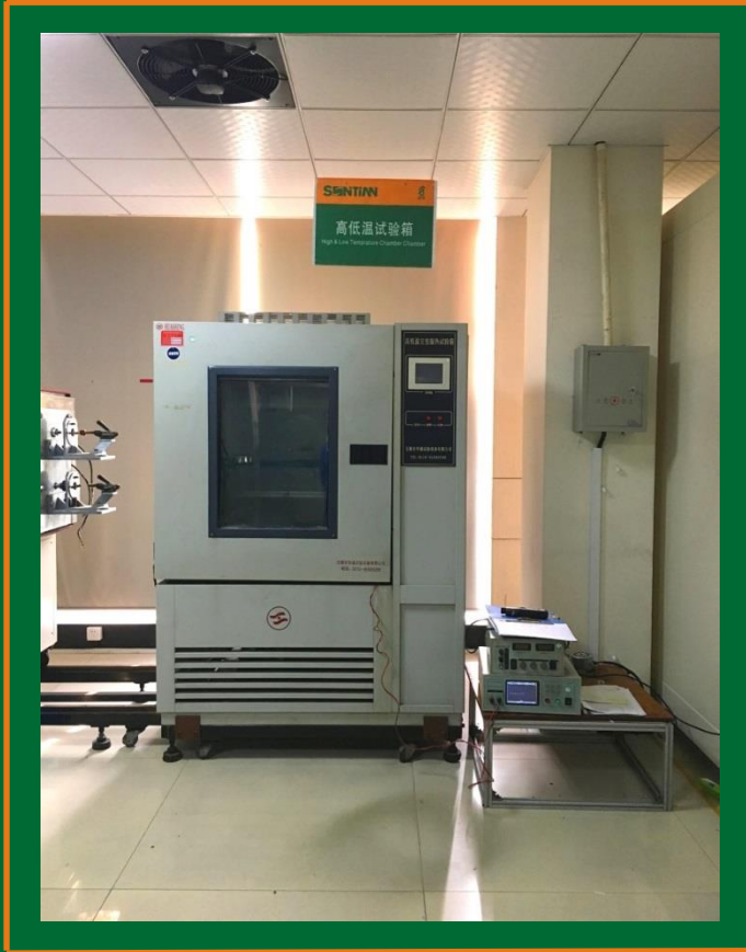
Бокс экстремальных температур

Zhejiang Songtian Automotive Motor System Co., Ltd